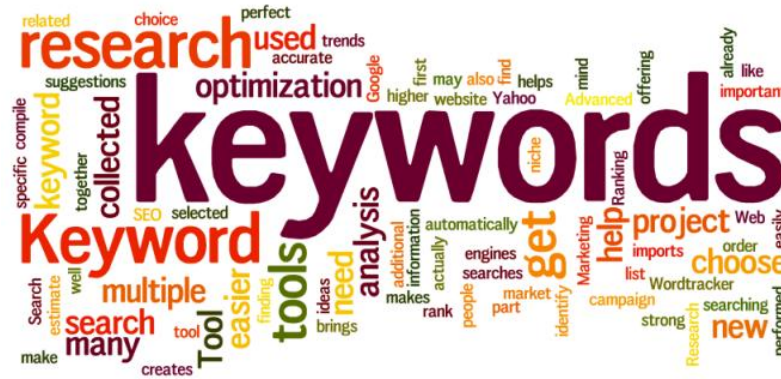
Hình 2. Phân tích từ khóa SEO cho dự án