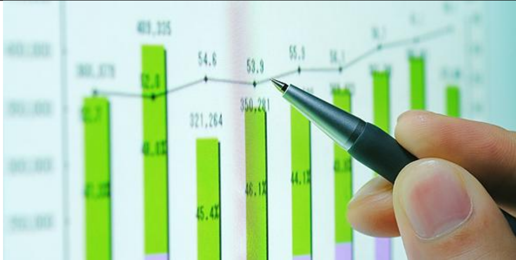
Hình 1. Phân tích đối thủ cạnh tranh khi bạn lên kế hoạch SEO WordPress